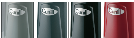
GRIS GRIS OSCURO NEGRO GRANATE